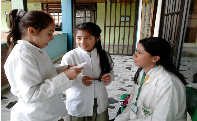
Fig 2 [Imagen de las niñas entrevistando a la profesora de matemáticas] (2013) Bogotá, Colombia.

Si me considero un ejemplo, porque en este mundo la mayoría de los matematicos son hombres, pienso que el mundo en que vivimos, los hombre y las mujeres tenemos las mismas capacidades, no creo en eso que las mujeres solo sirven para la cocina, porque desde la antigüedad se ha demostrado que las mujeres pueden sobresalir, Hipatia fue una de las mujeres que más sobresalio en la historia por ser la matemática más importante del mundo, y pues ella luchó contra todo eso. Es difícil, algunos estudiantes cuando ven que llega una profesora mujer piensan que pueden molestar y no lo toman en serio, pero ellos despues entienden que la figura que esta ahí, sea hombre o mujer va a enseñar las mismas matematicas. (Profesora)